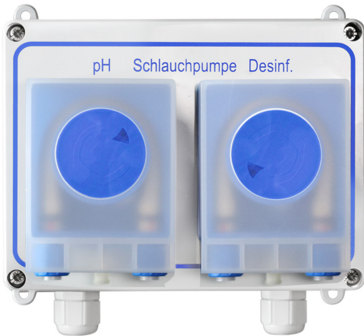
Beschriftung der Pumpe nur beispielhaft

Schlauchanschluss Schlauchmaterial Pumpe Ansaughöhe Schutzart